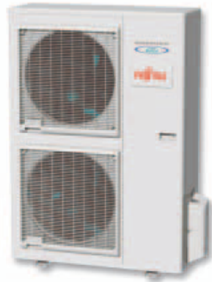
ACY 125 Ui