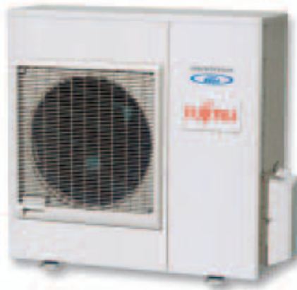
ACY 80-100 Ui