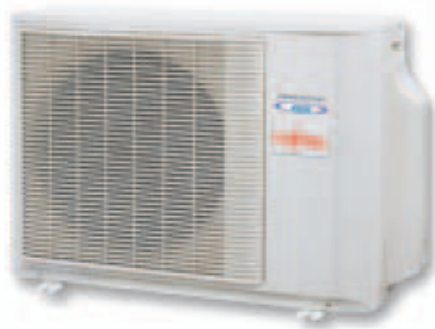
ACY 71 Ui B