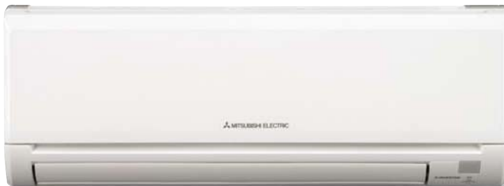
MSZ-GE25/35/42/50VA * CONSULTAR DISPONIBILIDADES

Una serie completa con equipos de estilizado diseño que incorporan las más altas tecnologías en ahorro energético, garantizando un ECONSUMO verdaderamente reducido. Además, sus altas prestaciones y su bajo nivel sonoro proporcionan el máximo ECONFORT en todo el hogar.